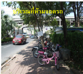
บริเวณที่ห้ามจอดรถ

เร่งขยายเส้นทางจักรยาน “โครงการจักรยานมหาวิทยาลัยเกษตรศาสตร์” โดยกองยานพาหนะฯ ได้ขยายเส้นทางให้กว้างขึ้น และปรับปรุงมิทคนเส้นทางระยะที่ ๑ โดยเส้นทางจักรยาน ๕ ระยะ แนวถนนระพีสตรีกร ประกอบด้วย ระยะที่ 1 หอพักนิสิตหญิง-สนามอินทรีชัยนทลลิต ระยะที่ ๑ สนามอินทรีชัยนทลลิต-สนามรักบี้ ระยะที่ ๑ สนามรักบี้-กองกิจการนิสิต ระยะที่ ๒ กองกิจการนิสิต-คณะวิทยาศาสตร์ ระยะที่ ๓ คณะวิทยาศาสตร์-ที่ทำการไปรษณีย์ (ฉบับที่ 177/๒551)