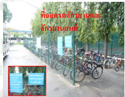
ที่จอดรถจักรยานและจักรยานยนต์

ห้ามจอดรถ กองยานพาหนะฯ ประกาศขอความร่วมมือห้ามจอดรถจักรยาน และจักรยานยนต์ บริเวณพุดบาททางเข้าออกประตูวิภาวดี ตั้งแต่วันที่ 14 พฤศจิกายน ๒๕๕1 โดยให้ย้ายรถไปจอดที่จอดรถจักรยานและจักรยานยนต์ประตูวิภาวดีฯ (ข้างสนามเทนนิส) โดยนิสิต บุคลากร และผู้ที่เป็นเจ้าของรถที่ถูกเคลื่อนย้ายไปที่งานรักษาความปลอดภัย โปรดติดต่อรับรถคืนได้ที่ ศูนย์เกษตรรวมใจ งานรักษาความปลอดภัย ประจวบวงศ์วาน ๑ โทร. ๐๒-๕79๕๕๒๖ , ๐๒-๑4๒๘119 ภายใน 1๒๐0, 14๐0 (ฉบับที่ 176/ ๒551)