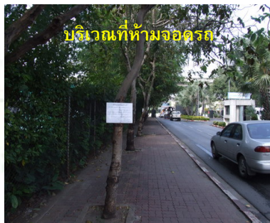
บริเวณที่ห้ามจอดรถ