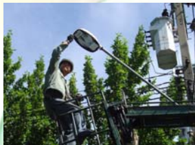
ด้านหลังคณะมนุษยศาสตร์

น้ำเสีย กองยานพาหนะฯ เฝ้าตรวจหาสาเหตุน้ำเสียและหาแนวทางการแก้ไขปัญหา บริเวณคูน้ำสำนักงานส่งเสริมและฝึกอบรม การแก้ไขปัญหาดังกล่าวโดยการขุดลอกตะกอนอินทรีย์วัตถุในคูน้ำในวันที่ 4 ตุลาคม 2551 (ฉบับที่ 146/2551)