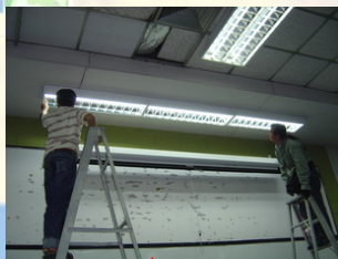
อาคารศูนย์เรียนรวม 1