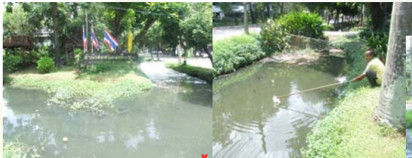
การเก็บตัวอย่างน้ำไปวิเคราะห์