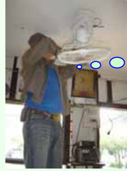
ซ่อมไฟฟ้า

กองยานพาหนะฯ ปรับปรุงทาสีโครงสร้างเหล็กติดป้ายประชาสัมพันธ์ บริเวณเกาะกลางถนนสุวรรณวจากกสิกิจ ระหว่างวันที่ 19-20 มกราคม ๒๕๕1 (ฉบับที่ ๕1/ ๒๕๕1)