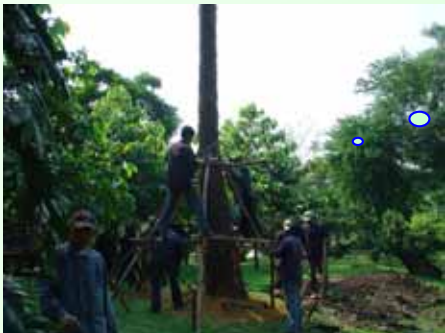
ขั้วขปลุก

กองยานพาหนะฯ แร่งขุดล้อมขั้วต้นตาลที่กั้นใบพาดสายไฟฟ้า บริเวณสวนปาล์มอาวุโส และขั้วปลุกบริเวณสวน 60 ปี มก. ในวันที่ 6 มีนาคม ๒๕๕1 (ฉบับที่ ๕๗/ ๒๕๕1)