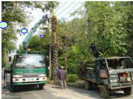
ขุดล้อม ขั้ว

กองยานพาหนะฯ ซ่อมแซมติดตั้งระบบไฟฟ้า ภายใน มก. ระหว่างวันที่ ๑๗ กุมภาพันธ์ - 14 มีนาคม ๒๕๕1 (ฉบับที่ ๕4/ ๒๕๕1)