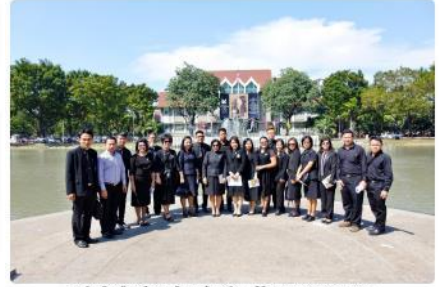
ภาพกิจกรรม(ประชุม)รับคณะศึกษาดูงานจากมหาวิทยาลัย KU GREEN CAMPUS, 13-12-2559