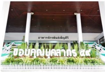
ภาพกิจกรรม จัดงานขอบคุณบุคลากร ประจำปี พ.ศ. 2559

กองยานพาหนะ อาคารและสถานที่ ในนามคณะอนุกรรมการฝ่ายสถานที่งานขอบคุณบุคลากร ประจำปี 2559 ได้รับมอบหมายให้ดำเนินการจัดและตกแต่งสถานที่ และให้บริการอาคารจักรพันธ์เพ็ญศิริในการจัดงานขอบคุณบุคลากร ประจำปี 2559 โดยมอบหมายงานสวนและรักษาความสะอาด จัดตกแต่งสถานที่ในพิธีทำบุญตักบาตร จัดโต๊ะเก้าอี้ภายในอาคาร จัดซุ้มถ่ายภาพบริเวณหน้างาน จัดโต๊ะลงทะเบียนพร้อมผูกผ้าระบาย มอบหน่วยช่างก่อสร้าง ดำเนินการติดตั้งป้ายงานบนเวทีและป้ายซุ้มอาหาร มอบหน่วยอาคารจักรพันธ์เพ็ญศิริดูแลในเรื่องการรักษาความสะอาด ห้องสุขา ระบบปรับอากาศพร้อมมอบหมายบุคลากรให้บริการภายในงานดังกล่าว งานขอบคุณบุคลากร ประจำปี 2559 จัดขึ้นในวันพฤหัสบดีที่ 29 ธันวาคม พ.ศ. 2559 ณ อาคารจักรพันธ์เพ็ญศิริ มหาวิทยาลัยเกษตรศาสตร์ บางเขน