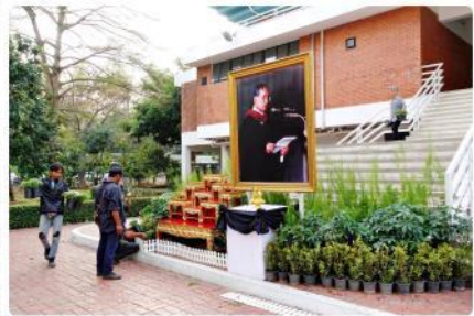
ภาพกิจกรรม จัดงานขอบคุณบุคลากร ประจำปี พ.ศ. 2559