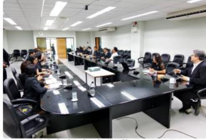
ภาพกิจกรรม(ประชุม)รับคณะศึกษาดูงานจากมหาวิทยาลัย KU GREEN CAMPUS, 13-12-2559