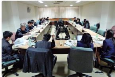
ภาพกิจกรรม อาคารและสถานที่เข้ารับการตรวจประเมินคุณภาพภายใน สำนักงานอธิการบดี ปี พ.ศ. 2559