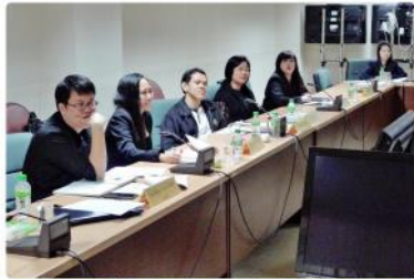
ภาพกิจกรรม อาคารและสถานที่เข้ารับการตรวจประเมินคุณภาพภายใน สำนักงานอธิการบดี ปี พ.ศ. 2559