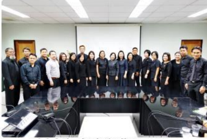
ภาพกิจกรรม(ประชุม)รับคณะศึกษาดูงานจากมหาวิทยาลัย KU GREEN CAMPUS, 13-12-2559