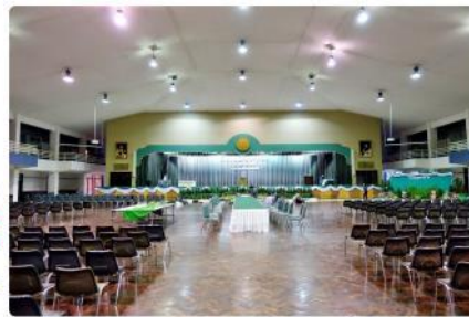
ภาพกิจกรรม จัดงานขอบคุณบุคลากร ประจำปี พ.ศ. 2559