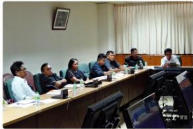
ภาพกิจกรรม อาคารและสถานที่เข้ารับการตรวจประเมินคุณภาพภายใน สำนักงานอธิการบดี ปี พ.ศ. 2559

กองยานพาหนะ อาคารและสถานที่ ในนามคณะอนุกรรมการฝ่ายสถานที่งานขอบคุณบุคลากร ประจำปี 2559 ได้รับมอบหมายให้ดำเนินการจัดและตกแต่งสถานที่ และให้บริการอาคารจักรพันธ์เพ็ญศิริในการจัดงานขอบคุณบุคลากร ประจำปี 2559 โดยมอบหมายงานสวนและรักษาความสะอาด จัดตกแต่งสถานที่ในพิธีทำบุญตักบาตร จัดโต๊ะเก้าอี้ภายในอาคาร จัดซุ้มถ่ายภาพบริเวณหน้างาน จัดโต๊ะลงทะเบียนพร้อมผูกผ้าระบาย มอบหน่วยช่างก่อสร้าง ดำเนินการติดตั้งป้ายงานบนเวทีและป้ายซุ้มอาหาร มอบหน่วยอาคารจักรพันธ์เพ็ญศิริดูแลในเรื่องการรักษาความสะอาด ห้องสุขา ระบบปรับอากาศพร้อมมอบหมายบุคลากรให้บริการภายในงานดังกล่าว งานขอบคุณบุคลากร ประจำปี 2559 จัดขึ้นในวันพฤหัสบดีที่ 29 ธันวาคม พ.ศ. 2559 ณ อาคารจักรพันธ์เพ็ญศิริ มหาวิทยาลัยเกษตรศาสตร์ บางเขน