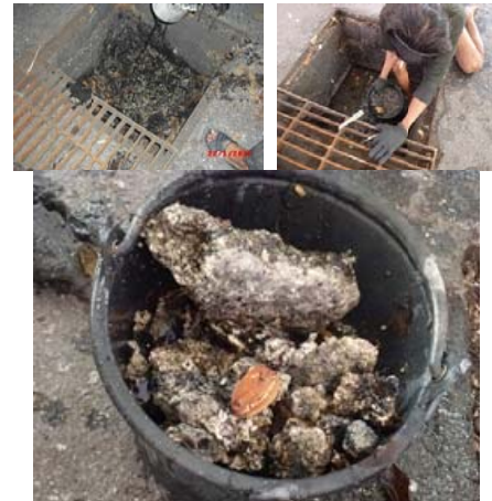
ที่มา: งานสวนและรักษาความสะอาด (๒๒-๒๓ ธ.ค. ๕๖)

ให้บริการยานพาหนะ สำหรับงานและกิจกรรมต่างๆ ได้แก่ นำคณะนิสิตเข้ารับพระราชทานทุนปีการศึกษา ๒๕๕๕, โครงการปันรักสู่น้อง ครั้งที่ ๔/๕๖ (Give Love For Child # 4) และจัดยานพาหนะดูพื้นที่สร้างวังส่วนพระองค์ สมเด็จพระเจ้าลูกเธอ เจ้าฟ้าจุฬาภรณวลัยลักษณ์ อัครราชกุมารี เป็นต้น