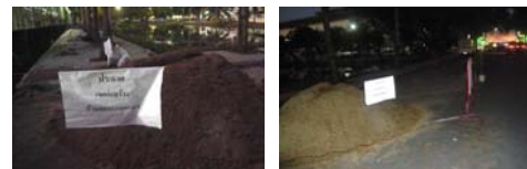
ที่มา: งานรักษาความปลอดภัย (๑๔ ม.ค. ๕๖)

ติดป้ายประชาสัมพันธ์ “เขตก่อสร้าง ห้ามจอดตลอดแนว” บริเวณข้างอาคารจักรพันธ์เพ็ญศิริ ให้ผู้ขับซึ่รถยนต์ปฏิบัติตามกฎจราจร เพื่อเป็นการป้องกันการเกิดอุบัติเหตุ เพิ่มความสะดวกและปลอดภัย