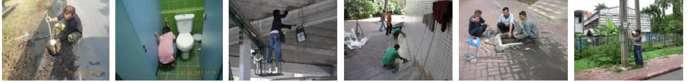
ที่มา: งานซ่อมบำรุง (๑๗ ธ.ค. ๕๕-๑๗ ม.ค. ๕๖)

ติดตั้ง “ป้ายประชาสัมพันธ์ รับผิดชอบต่อสังคม” บริเวณตั้งแต่แยกออกกึ่งจนถึงโดยรอบอาคารจักรพันธ์เพ็ญศิริ เพื่อเตรียมความพร้อมรับเสด็จ พระเจ้าวรวงศ์เธอ พระองค์เจ้าโสมสวลีฯ ทรงเสด็จเปิดงาน แบรินด์ซัมเมอร์แคมป์ ปี ๕๖