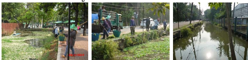
ที่มา: งานสวนและรักษาความสะอาด (๒๔-๒๕ ม.ค. ๕๖)

การให้บริการห้องประชุม อาคาร และสถานที่ บริเวณเวทีและลานหน้าสำนักพิพิธภัณฑฯ เพื่อจัดงานเลี้ยงรับรองในพิธีปิดการแข่งขันฟุตบอล ๔ เส้า “KASETSART INVITATION 2013”