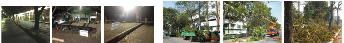
ที่มา: งานรักษาความปลอดภัย (๑๗ ม.ค. ๕๖)

ติดตั้ง “ป้ายประชาสัมพันธ์ รับผิดชอบต่อสังคม” บริเวณตั้งแต่แยกออกกึ่งจนถึงโดยรอบอาคารจักรพันธ์เพ็ญศิริ เพื่อเตรียมความพร้อมรับเสด็จ พระเจ้าวรวงศ์เธอ พระองค์เจ้าโสมสวลีฯ ทรงเสด็จเปิดงาน แบรินด์ซัมเมอร์แคมป์ ปี ๕๖