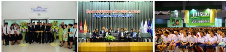
ที่มา: งานบริหารกลุ่มงานอาคารพิเศษ (๑-๓๑ ม.ค. ๕๖)

การให้บริการสถานที่ อาคารสารนิเทศ ๕๐ ปี, อาคารจักรพันธ์ฯ, อาคารจอตระถนวมวงศ์วาน ๑ - ๒, อาคารจอตระถนบางเขน และอาคารจอตระถนวิภาวดีรังสิต อาทิ พิธีเปิดห้องอ่านหนังสือและกิจกรรมนิสิต, โครงการปัจฉิมนิเทศนิสิตชั้นปีที่ ๔, โครงการแบรินด์ซัมเมอร์แคมป์ ประจำปี ๒๕๕๖ และแถลงข่าวงานวันเกษตรแห่งชาติ ประจำปี ๒๕๕๖ และการจัดประชุมทางวิชาการครั้งที่ ๕๑ เป็นต้น