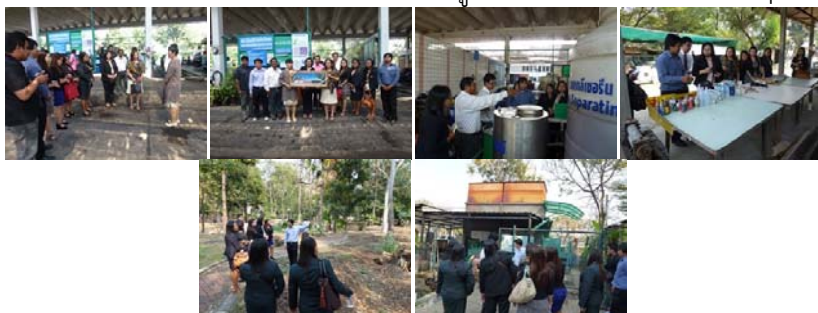
ที่มา: งานสวนและรักษาความสะอาด และงานยานพาหนะ (๒๑ ม.ค. ๕๖)

คณะอาจารย์จากคณะเทคโนโลยีการจัดการ มหาวิทยาลัยเทคโนโลยีราชมงคลศรีวิชัย วิทยาเขตนครศรีธรรมราช จำนวน ๑๐ คน ศึกษาดูงานโครงการ KU-Green Campus