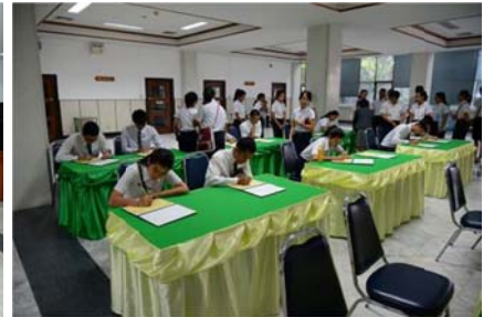
ที่มา: กองยานพาหนะอาคารและสถานที่ (3 ธ.ค. 56) ภาพ : งานประชาสัมพันธ์ มก.