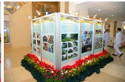
ที่มา: กองยานพาหนะอาคารและสถานที่ (7 ธ.ค. 56) ภาพ : งานประชาสัมพันธ์ มก.

จับกุม นายวรกร ว่องวิทย์การ ซึ่งก่อเหตุลักทรัพย์บริเวณสนามอินทรียัยจันทร์สถิตย์ และประสานงานกับสถานีตำรวจนครบาลบางเขนมารับตัวผู้ต้องหาไปดำเนินคดีตามกฎหมายต่อไป ที่มา: งานรักษาความปลอดภัย (13 ธ.ค. 56)