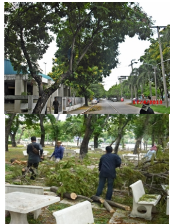
ที่มา: งานสวนและรักษาความสะอาด (๑๗ เม.ย. ๕๖) ตัดและเก็บต้นไม้โคนล้มและกิ่งไม้หัก เนื่องจาก ฝนตกหนักและลมพัดแรง บริเวณต่างๆ