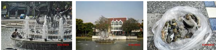
ที่มา: งานสวนและรักษาความสะอาด (๔ เม.ย. ๕๖)

การให้บริการห้องประชุม อาคาร และสถานที่ อาทิ กรมยุทธศึกษาทหารบกใช้สถานที่สอบคัดเลือกบุคคลพลเรือน-ทหารประทวนฯ ของกรมยุทธศึกษาทหารบกเข้าประจำการ ณ อาคารศูนย์เรียนรวม ๔, ประชุมคณะกรรมการดำเนินการจัดการประชุมเวทีข่าวไทย ณ ห้องประชุมอาคารวิจัยและพัฒนา ห้อง ๓๐๖ ชั้น ๓, ประชุมการทำงานโครงการพัฒนาวิชาการ ณ ห้องประชุมอาคารวิจัยและพัฒนา ห้อง ๓๐๖ ชั้น ๓, ประชุมหารือการจัดนิทรรศการประชุมสุดยอดมหาวิทยาลัยวิจัยแห่งชาติ ครั้งที่ ๒ ณ ห้องประชุมอาคารวิจัยและพัฒนา ห้อง ๖๐๑