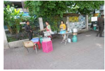
ที่มา: งานรักษาความปลอดภัย (๓ เม.ย. ๕๖) ติดตั้งกิ่งไม้ บริเวณด้านหน้าสนามออกกอล์ฟ และ บริเวณศาลาหกเหลี่ยม