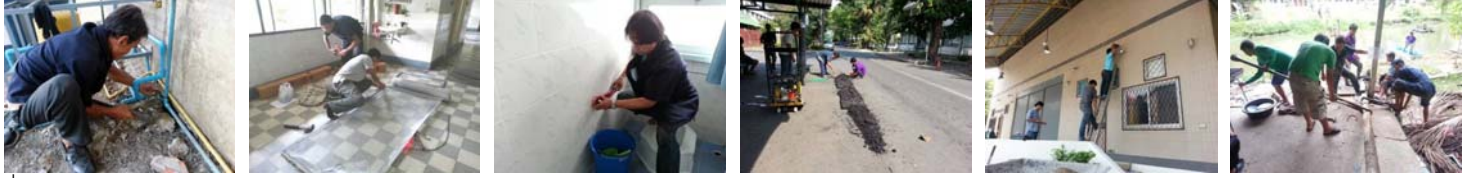
ที่มา: งานบำรุงรักษาอาคารกิจการนิสิต (๒๑ มี.ค.-๒๐ เม.ย. ๕๖)