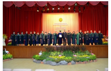
ที่มา : งานบริหารกลุ่มงานอาคารพิเศษ (๑-๓๑ ต.ค. ๕๕)

การให้บริการสถานที่ อาคารสารนิเทศ ๕๐ ปี, อาคารจักรพันธ์, อาคารจอตระกูลวงษ์วาน ๑ - ๒, อาคารจอตระกูลบางเขน และ อาคารจอตระกูลวิภาวดีรังสิต อาทิ พิธีมอบปริญญาปรัชญาดุษฎีบัณฑิตกิตติมศักดิ์แก่ ศาสตราจารย์อารอน เจ. ซิฆาโนเวอร์ ประชุมเพื่อสรุป รายงานผลการวิจัย ตั้งแต่ พ.ศ. 2552-2555 ของ โครงการ “การศึกษาแบบองค์รวมของการปรับตัวในบริบท ใหญ่ที่แตกต่างของกลุ่มชาติพันธุ์ไทย-ลาว ในพื้นที่ลุ่มน้ำภาคกลางของประเทศไทย และการจัดกิจกรรมเปิด บ้าน “Open House” ในโอกาสครบรอบ 50 ปีของสถาบันเทคโนโลยีนิวเคลียร์แห่งชาติ เป็นต้น