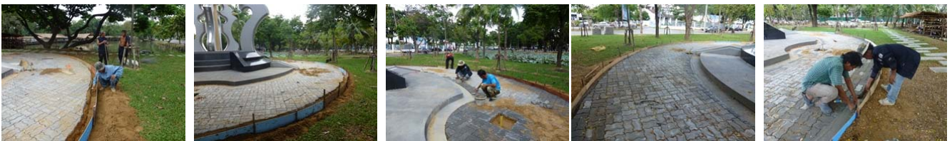
ที่มา: งานสวนและรักษาความสะอาด (๒๔ ต.ค. ๕๕)