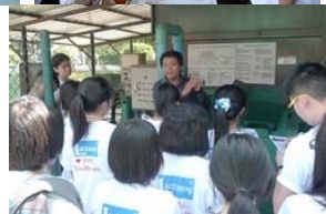
ที่มา: งานสวนและรักษาความสะอาด และงานยานพาหนะ (๑๘ ต.ค. ๕๕)