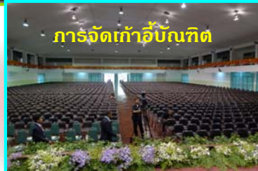
การจัดเก้าอี้บัณฑิต