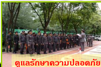
ดูแลรักษาความปลอดภัยและจราจร