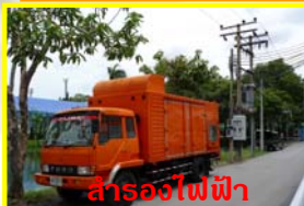
สำรองไฟฟ้า