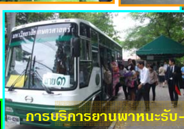
การบริการยานพาหนะรับ-ส่งบัณฑิตและญาติ