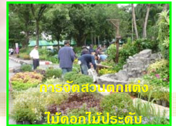
การจัดสวนตกแต่ง ไม้ดอกไม้ประดับ