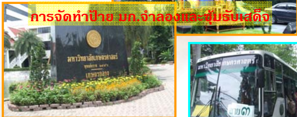
การจัดทำป้าย มก. จำลองและจัดรับเสด็จ