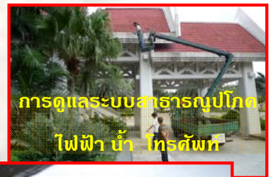
การดูแลระบบสาธารณูปโภค ไฟฟ้า น้ำ โทรศัพท์