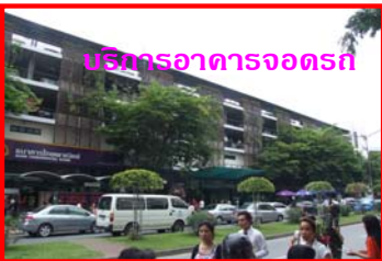
บริการอาคารจอดรถ