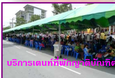
บริการเตนท์ที่พักญาติบัณฑิต