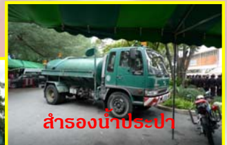
สำรองน้ำประปา