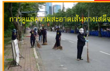
การดูแลความสะอาดเส้นทางเสด็จ