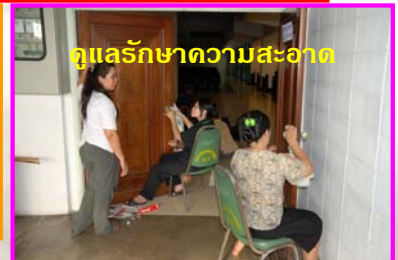
ดูแลรักษาความสะอาด