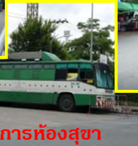
บริการห้องสุขา