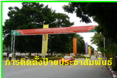
การติดตั้งป้ายประชาสัมพันธ์