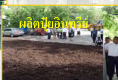
ผลิตไบโอดีเซล