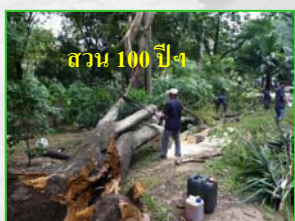
สวน 100 ปี