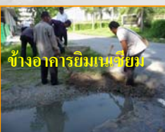
ช่างอาคารนิเทศ 50 ปี