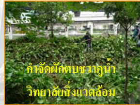
กำจัดผักตบชวาคูน้ำวิทยาลัยสิ่งแวดล้อม

ดูแลรักษาคูคลอง การดูแลรักษาคูคลอง และท่อระบายน้ำใน มก. เพื่อปรับปรุงสภาพภูมิทัศน์ให้สวยงามน่าดู นามองระหว่างวันที่ 27 กรกฎาคม -20 สิงหาคม 2552