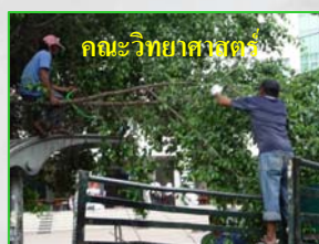
คณะวิทยาศาสตร์