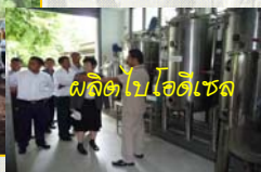
ผลิตไบโอดีเซล