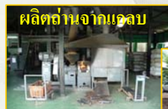
ผลิตถ่านจากแกลบ

บุคลากรจากกองยานพาหนะฯ จำนวน 12 คน เข้าเยี่ยมชมกิจการโครงการส่วนพระองค์สวนจิตรลดา อาทิ เช่น การผลิตแก๊สโซฮอล์ ไบโอดีเซล การผลิตถ่านจากแกลบ เป็นต้น