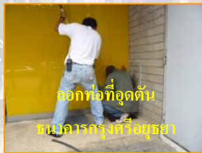
ทาสีกำแพงที่อุดตันแนวอาคารสูงศรีบูรพา

ปรับปรุงซ่อมแซมระบบสาธารณูปโภค ซ่อมแซมครุภัณฑ์ให้มีสภาพพร้อมใช้งานเพื่อใช้ในการดำเนินกิจกรรมต่างใน มก. ระหว่างวันที่ 1- 19 สิงหาคม 2552 มีปัญหาเรื่องระบบสาธารณูปโภคติดต่อได้ที่งานซ่อมบำรุง