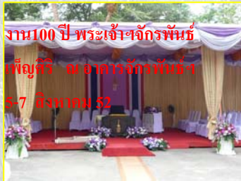
งาน 100 ปี พระเจ้าจักรพรรดิ เพ็ญศรี ณ อาคารจักรพรรดิ 8-7 สิงหาคม 52