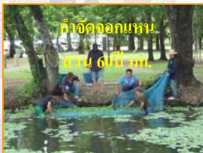
กำจัดจอกแหนสวน 6 ปี มก.