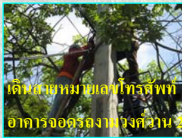
เดินเก็บหมากแผลงโทรศัพท์อาคารจอร์จงานึงจี่วาน