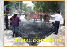
เขตคณะสังคมศาสตร์