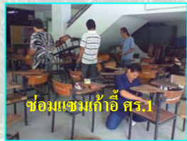
ห้องประชุมแก้วอี ศรี.1

ความปลอดภัยการใช้เส้นทาง ของบุคลากรนิสิต