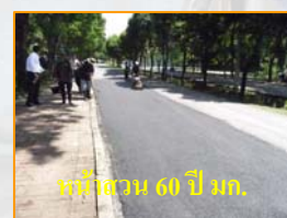
หน้าสวน 60 ปี มก.