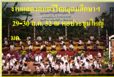
งานแสดงดนตรีในหลุมมศึกษา 29-30 ส.ค. 52 ณ หอประชุมใหญ่ มก.