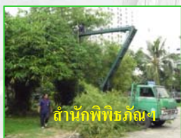
สำนักพิพิธภัณฑ

เร่งดำเนินการตัดแต่งต้นไม้ตัดต้นไม้ที่โค่นล้มกรณีฝนตกมีลมแรง และกิ่งไม้พาดหม้อแปลงไฟฟ้า ภายใน มก. ระหว่างวันที่ 18-19 สิงหาคม 2552