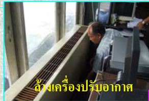
ล้างเครื่องปรับอากาศ